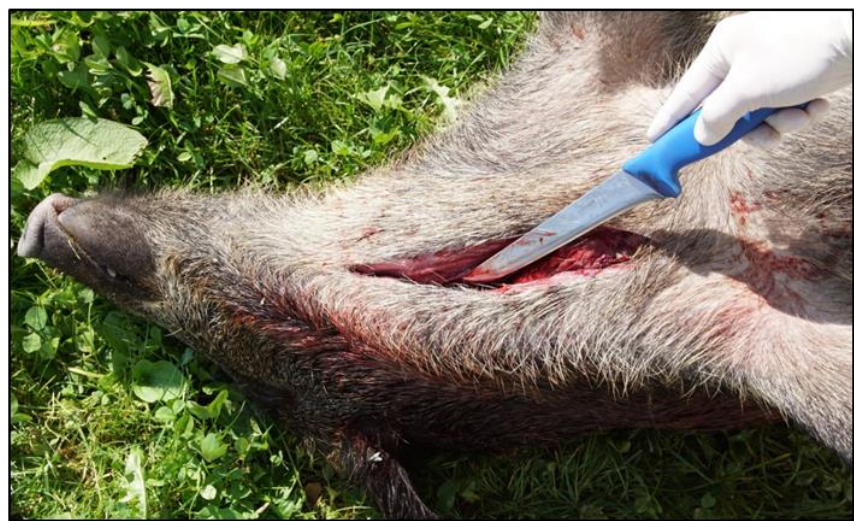
Abb. 2: Eröffnung der Halsvene mittels Längsschnitt zur Blutprobenentnahme