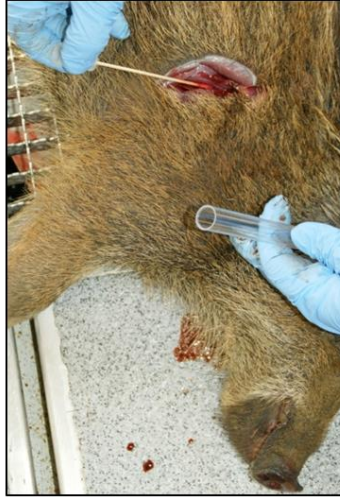
Abb. 4: Entnahme einer Tupferprobe