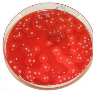
saubere Probenahme: Reinkultur Staph. aureus

Die Untersuchung einer sauberen Milchprobe liefert dagegen zuverlässige Ergebnisse zu Zellzahl, Art des Erregers und seiner Empfindlichkeit gegenüber antibiotisch wirksamen Arzneimitteln.