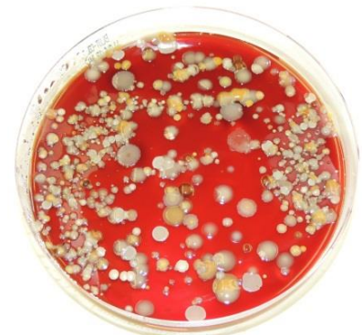
verunreinigte Probe: Mischflora

Sinnvoll ist die Untersuchung von Viertelgemelksproben vor allem bei Anzeichen einer akuten Euterentzündung wie sichtbaren Veränderungen der Milch, Erhöhung der Zellzahl, Rötungen, Schwellungen und Fieber. Schalmtest-positive Viertel ohne diese Entzündungsanzeichen weisen auf subklinisch oder chronisch infizierte Viertel hin. Die Beprobung dieser Viertel ist oft nur begrenzt aussagekräftig, weil häufig nur noch Begleiterreger und nicht die eigentlich ursächlichen Erreger nachgewiesen werden. Dennoch können gezielte Beprobungen solcher Viertel z. B. vor dem Trockenstellen sinnvoll sein, um eine Hilfestellung bei der Trockenstellerauswahl zu erhalten.