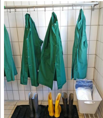
Betriebseigene Kleidung bereitstellen

Weitere Informationen dazu können dem Merkblatt zu Biosicherheitsmaßnahmen des STUA Aulendorf – Diagnostikzentrum unter www.stua-aulendorf.de entnommen werden.