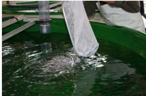
Abb. 4: Geimpfte Felchenbrütlinge werden in ein frisch gereinigtes Becken gesetzt.