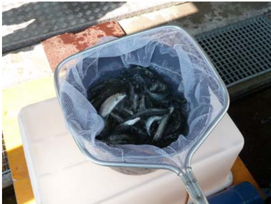
Abb. 3: Impfung von adulten Felchen gegen Furunkulose

Als Furunkulose-Impfstoff ist zwar ebenfalls eine kommerzielle Vakzine auf dem Markt, diese steht aber aufgrund mangelnder Nachfrage derzeit nicht zur Verfügung. Daher wurden für einen Felchen- und einen Saiblingsbestand jeweils bestandsspezifische Furunkulose-Impfstoffe hergestellt. Dabei handelte es sich ebenfalls um ein Tauchbad, in das die Fische getaucht wurden. Aussagen über die Wirksamkeit der Impfung werden erst im weiteren Verlauf der Entwicklung möglich sein.