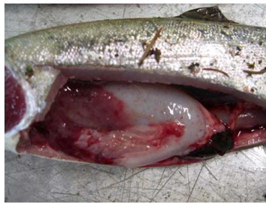
Abb. 2: An Rotmaulseuche erkrankte Regenbogenforelle

Die Furunkulose wird hervorgerufen durch Aeromonas salmonicida spp. salmonicida . Sie betrifft insbesondere Bachforellen, Saiblinge und Felchen. Unterschieden werden die perakute und akute Form sowie die subakute und die chronische Form. Nur bei letzteren beiden treten die typischen Hautgeschwüre auf. Regelmäßig tritt außerdem eine Milzschwellung und eine Darmentzündung auf. Auch diese Erkrankung kann hohe Verluste verursachen.