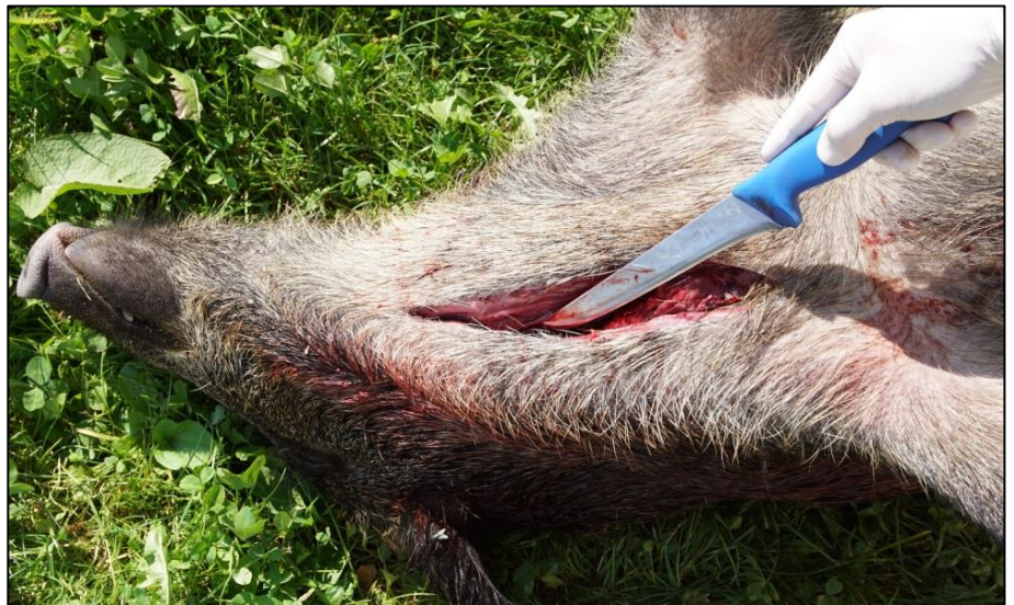
Abb. 2: Eröffnung der Halsvene mittels Längsschnitt zur Blutprobenentnahme