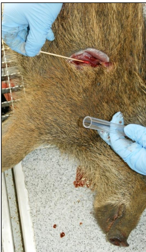
Abb. 4: Entnahme einer Tupferprobe

Um einen Seucheneintrag frühzeitig zu erkennen, ist die Beprobung tot aufgefundener Stücke und krank erlegter Tiere besonders wichtig. Diese sog. Indikatortiere müssen immer beprobt werden.