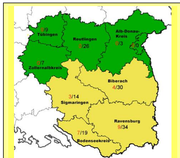
Abbildung 1: Anzahl der Räude-Erkrankungen (rot) beim Fuchs sowie die Anzahl untersuchter Füchse im Regierungsbezirk Tübingen verteilt auf die Landkreise im Jahr 2015. Grün hinterlegt sind Land- bzw. Stadtkreise ohne Räuadenachweis.