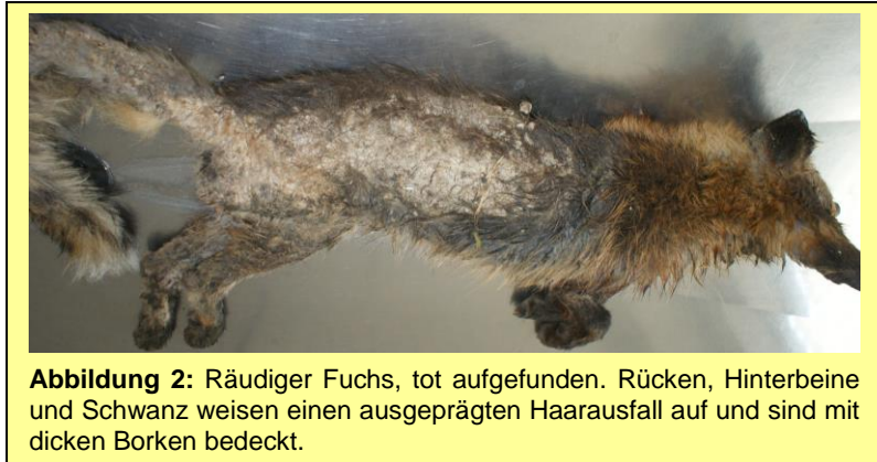
Abbildung 2: Räumiger Fuchs, tot aufgefunden. Rücken, Hinterbeine und Schwanz weisen einen ausgeprägten Haarausfall auf und sind mit dicken Borken bedeckt.

Bei der Räude handelt es sich um eine Faktorenkrankheit, die mit starkem Juckreiz einhergeht. Der Juckreiz wird durch mechanische Reize (Grabtätigkeit der Milben), toxische Produkte, Speichel mit allergischen Substanzen und durch freigelegte Nervenendigungen in der Haut hervorgerufen. Verantwortlich für die Entstehung der Hautveränderungen sind vor allem